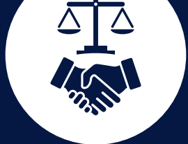
ပုံ ၅။ နိုင်ငံရေးပြောင်းလဲမှုဖြစ်စဉ်များ

ဆိုင်ရာ ပူးတွဲစောင့်ကြည့်ရေးကော်မတီ (JMC) ရှိ ၎င်း၏ ခေါင်းဆောင်မှု အခန်းကဏ္ဍကို အလေးအနက်ထားပဲ NCA ကျင့်ဝတ်ဖောက်ဖျက်မှုများ နှင့် အပစ်အခတ် ရပ်စဲရေး ချိုးဖောက်မှုများကို လုံလောက်စွာဆောင်ရွက်ရန် ပျက်ကွက်ခဲ့သည်။ ကာကွယ်ရေးဦးစီးချုပ် မင်းအောင်လှိုင်၏ အာဏာရှင်ဆန် ဆန်ချဉ်းကပ်မှုသည် မြန်မာစစ်တပ်၏ အထက်အောက်ယဉ်ကျေးမှုကို ထင်ဟပ် ခဲ့သည်။ စစ်တပ်တစ်ခုအတွက် ခိုင်မာအားကောင်းသည့် အမိန့်ပေးကွပ်ကဲမှု ကွင်းဆက် (chain of command) ရှိရန် လိုအပ်သော်လည်း မြန်မာစစ်တပ် တွင်း အာဏာကို အလွန်သေးငယ်သော ခေါင်းဆောင် တစ်စုကသာ ဆုပ်ကိုင် ထားသည်။ ဤသည် က JMC အနေဖြင့် လက်တွေ့တွင် အမှီအခိုကင်းသော ဆုံးဖြတ်ချက်များချမှတ်နိုင်ရန် မဖြစ်နိုင်စေခဲ့ပါ။