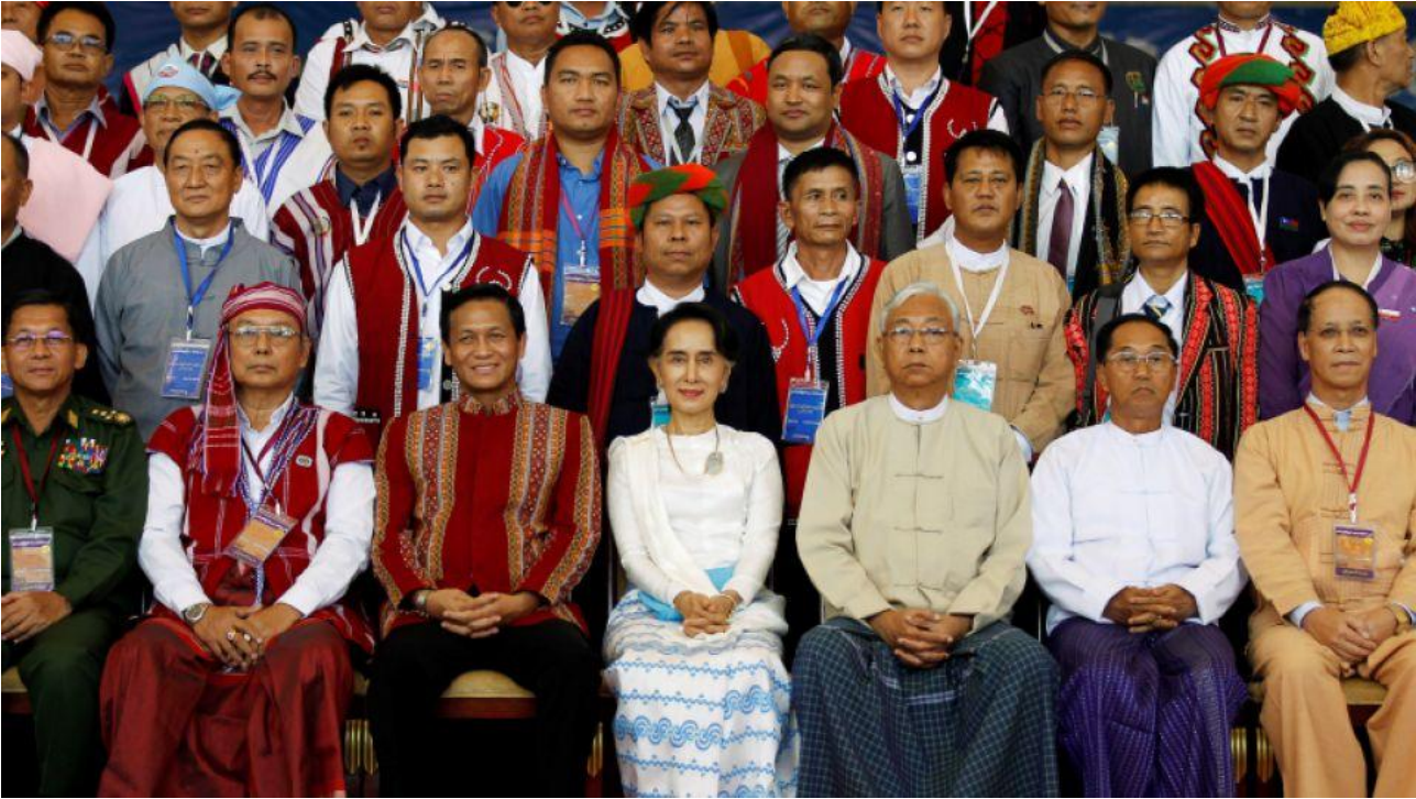
ပုံ ၃။ ပထမအကြိမ် ပြည်ထောင်စုငြိမ်းချမ်းရေးညီလာခံ (၂၀၁၆) ဒေါ်အောင်ဆန်းစုကြည်သည် EAO ကိုယ်စားလှယ်များနှင့် အကြီးတန်းပုဂ္ဂိုလ်များ အလည်တွင် ထိုင်သည်။ ညီလာခံသည် ထောက်ခံမှု အချို့ရရှိခဲ့သော်လည်း ပါဝါမညီမျှမှုများကို ပြန်လည်ချိန်ညှိရန် ပျက်ကွက်ခဲ့ခြင်းနှင့် အပေါ်ယံဖြစ်သော ဆောင်ရွက်မှုများကြောင့် ဝေဖန်ခံခဲ့ရသည်။

NLD မှ အစိုးရခေါင်းဆောင်ပိုင်းတာဝန်ယူသည့်အခါ ဤစေ့စပ်ညှိနှိုင်းမှု ချဉ်းကပ်မှု နည်းလမ်းနှင့် တိုးတက်မှုတို့ကို ပစ်ပယ်လျစ်လျူရှုခဲ့သည်။ ဒေါ်အောင်ဆန်းစုကြည်၏ အစိုးရသည် EAO များနှင့် ယုံကြည်မှုတည်ဆောက်မှုတွင် ရင်းနှီးမြှုပ်နှံမှု အလွန်နည်းပါးခဲ့သည်။ တိုင်းရင်းသားခေါင်းဆောင်များ အပေါ် ထားရှိပြသသည့် သဘောထားမှာ တစ်စီးပြီး လိုလောက်သော လေးစားမှုမရှိဟု ဖော်ပြသတ်မှတ်ခံခဲ့ကြ သည်။